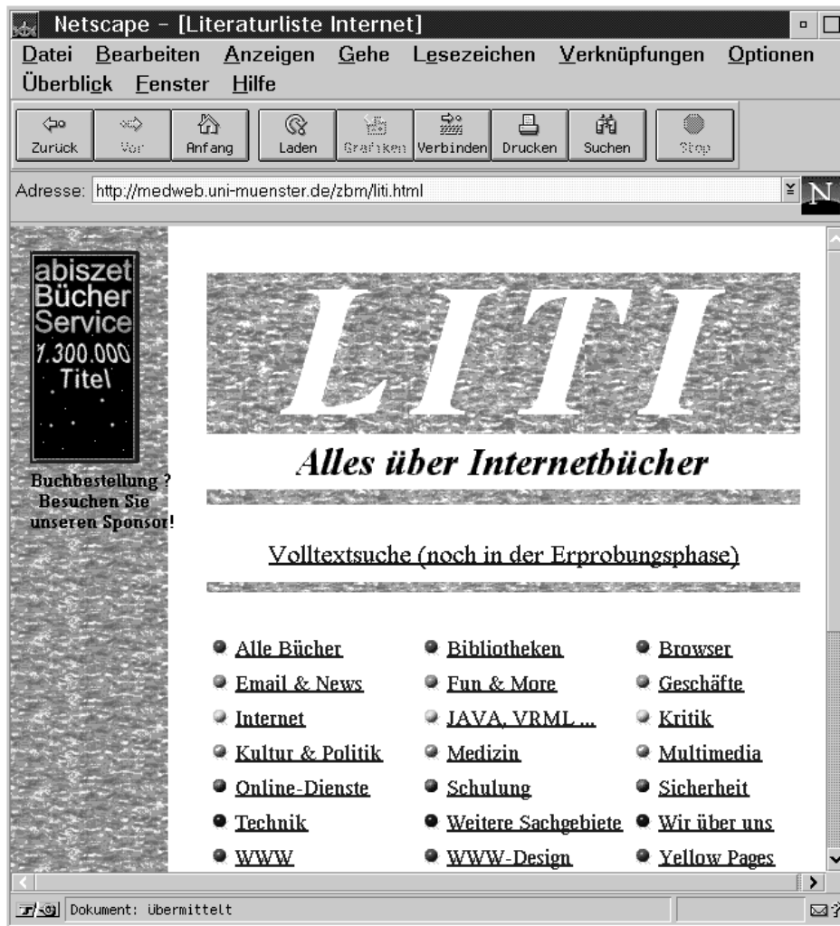
Abb. 2: LITI-Homepage http://medweb.uni-muenster.de/zbm/liti.html