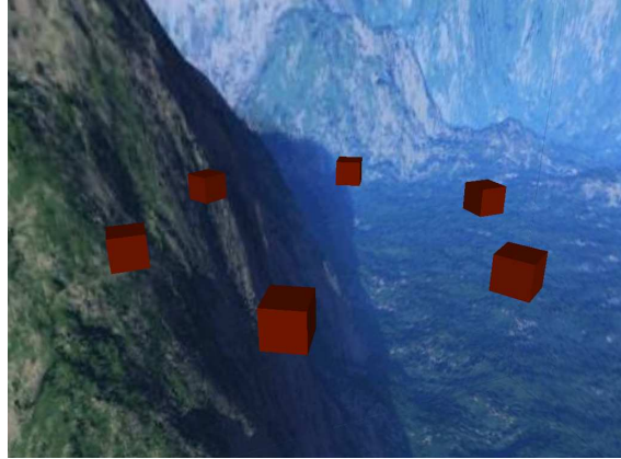
Abbildung 3: Screenshot der mit dem Skript aus Abb. 2 erzeugten Szene

Mit dem INPUT -Statement werden hier die Eingabemenge und ihre Attribute deklariert. So weiß die VE, dass sie zur Laufzeit Datensätze aus einer externen Quelle erhält, die sie als Elemente der Menge snortIn speichern wird. Die für sourceIP , destIP und severityCode angegebenen Werte sind lediglich Standardwerte, die nur angenommen werden, falls ein eintreffender Datensatz unvollständig spezifiziert wurde.