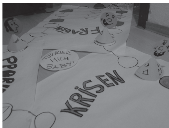
Abb. 2 Spielbrett

Zu Beginn des Spiels werden aus dem Kreis der Teilnehmenden drei Spielgruppen gebildet, die sich je für eine Spielfarbe entscheiden und auswürfeln, wer anfangen darf. Die höchste Würfelzahl beginnt. Die entsprechende Mannschaft würfelt erneut und zieht der Augenzahl entsprechend auf dem Spielbrett nach vorne. Trifft die Gruppe