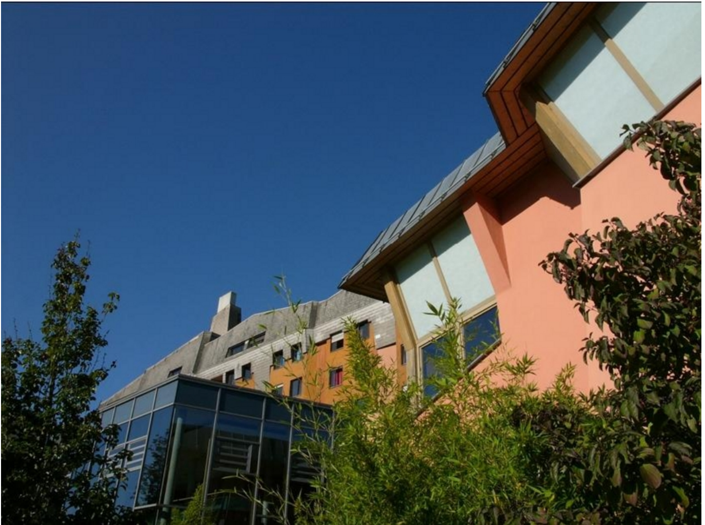
Abbildung: Gemeinschaftskrankenhaus Herdecke

Strukturierter Qualitätsbericht für das Berichtsjahr 2008