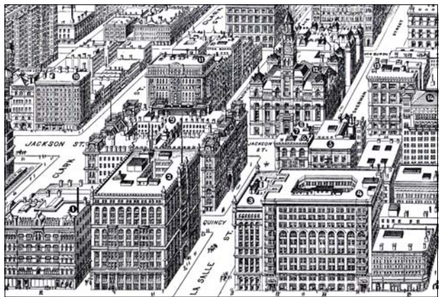
Abb. 3: Chicagos Board of Trade und Umgebung aus der Vogelperspektive, 1898

Giedion bewunderte dabei nicht nur die Dynamik der Entwicklung, sondern er sah hier auch eine neue Rolle der baulich-räumlichen Formgebung. Die Baukörper der neuen Hochhäuser waren alle nach dem gleichen Quaderprinzip konzipiert. So wie das Schachbrett-Muster bedeutete, dass nicht bestimmte Standorte von vornherein hervorgehoben wurden, indem sie z.B. den Endpunkt einer (oder mehrerer) Achsen bildeten, gab es keine individuelle, nur auf das einzelne Gebäude zugeschnittene Bauform mehr. Sie unterschieden sich – bis auf äußere Gestaltungselemente bei der Fassade – nur durch ihre Höhe und Breite. Eine individuelle „Persönlichkeit“ der Bauten, die in ihrem Äußeren ihr Innenleben oder ihren Zweck ausdrückten, war nicht mehr erkennbar. Wenn der Architekt John Root 1890 forderte, die neuen Bauwerke sollten „nur mit ihrer Masse und Proportion in einem weiten, elementaren Sinne der Idee der großen beständigen und bewahrenden Kräfte der modernen Zivilisation Ausdruck verleihen“ (zit. n. Giedion 1965: 250), forderte er im Grunde eine Trennung von Form und Inhalt. Die Aufgabe der