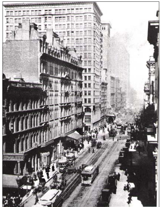
Abb.2: Randolph Street, East from LaSalle, 1892

Freilich ist nicht alles mit dem Hinweis auf das neue Verkehrsmittel beantwortet. Zum Massenverkehrsmittel gehören ja die entsprechenden Transportmassen, und die waren in den ersten Siedlerzeiten nicht gegeben. Damit sich in Chicago Skaleneffekte der Eisenbahn bemerkbar machen konnten, musste sich etwas in der gesamten Wirtschafts- und Existenzweise des Westens geändert haben. Tatsächlich begann in der zweiten Hälfte des 19. Jahrhunderts in den Prärien die massenhafte Erzeugung von Getreide und Vieh für einen größeren Markt, vor allem für die Bevölkerungskonzentrationen der sich industrialisierenden und urbanisierenden Ostküste. Eine kontinentale Arbeitsteilung Mittlerer Westen-Ostküste entstand. Chicago wurde Glied eines industriellen Produktionsprozesses, und zwar im Lebensmittelbereich. Im Vergleich zu seinen anfänglichen Hauptkonkurrenten (St. Louis und New Orleans als „Südtor“) verfügte es