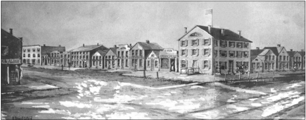
Abb. 1: Lake and Dearborn Southwestward 1838