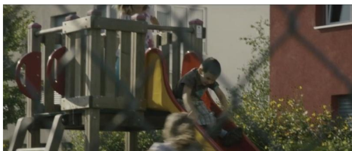
Abb. 2 Spielplatz