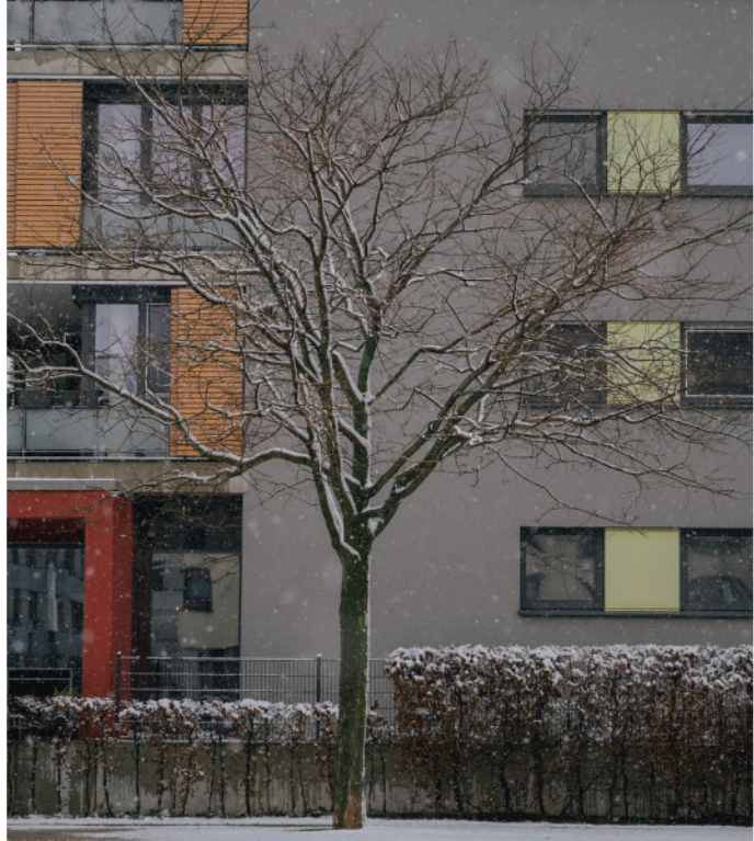
Baum vor einem Wohnhaus in der Grünen Mitte