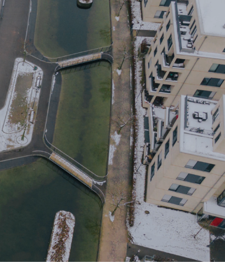
Luftaufnahme Grüne Mitte

Auf unseren Streifzügen wird das 19. Jahrhundert im Fokus stehen, die Zeit der großen industriellen Transformation. Unser Fokus richtet sich auch auf die Namen der Industriellen, die mit den damaligen massiven Veränderungen verbunden werden. Viele andere bleiben damit ungenannt. Die bekannten Namen sollen allerdings nicht primär für die Geschichte konkreter Personen stehen, sondern für ein bestimmtes Denken und Handeln, das lokale und globale Entwicklungen bis heute formt.