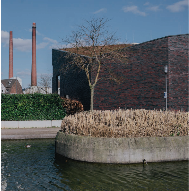
Hörsaalgebäude der Universität, alte Schlote der Zeche Victoria Mathias im Hintergrund

Wie anders gearbeitet wird, und wie sehr sich der städtische Raum verändert hat, in dem heute die Grüne Mitte liegt, lässt sich vielleicht am besten an der Geschichte der RWE-Firmenzentrale zeigen. 1898 gründete Hugo Stinnes auf dem Gelände der Zeche Victoria Mathias, deren Eigentümer er war, die Rheinisch-Westfälischen Elektrizitätswerke. Die RWE AG und ihr Produkt, die Elektrizität, brachten Essen viel Wohlstand, ließ die Stadt aber auch Jahrzehntelang im Nebel der Industrieabgase versinken (siehe Seite 28-31). Die Zeche Victoria Mathias, deren Ruß, Lärm und Gestank den Essener Norden lange prägten, wurde nach dem Krieg nicht wieder aufgebaut. Dafür kehrte 2020 die Firmenzentrale der RWE an ihren Gründungsort zurück. Heute möchte das Unternehmen hier vor allem nachhaltige Energieversorgung entwickeln. So liegt, auch sprachlich eingefügt in die neue Arbeitswelt, in Sichtweite des Uni-Campus der sogenannte RWE-Campus – ein energieeffizienter Bürokomplex mit grüner Parkanlage und Anbindung an den Radschnellweg Ruhr.