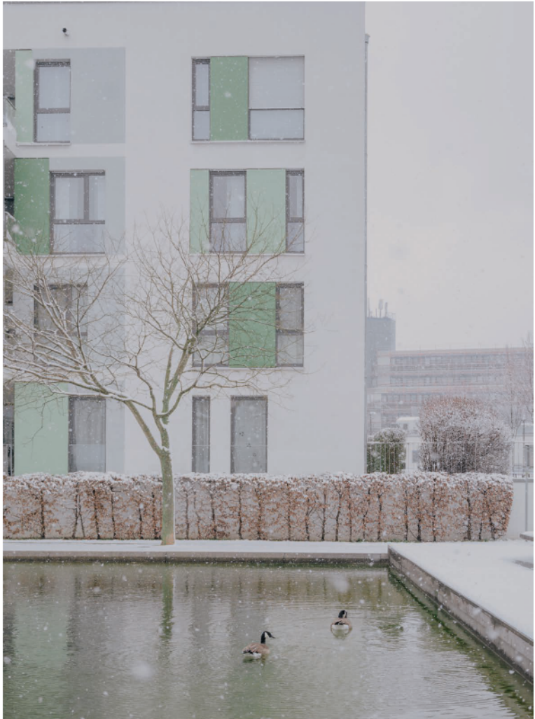
Wohnhaus der grünen Mitte

Und in einem Leserbrief beklagt ein Arbeiter: „Es steht wohl außer Frage, daß der geplante Stadtwald in erster Linie eine große Wohltat für die Arbeiterbevölkerung Essens ist, für die große Masse, die in engen Wohnungen leben muß. Aber trotzdem hegen wir Arbeiter Befürchtungen, daß unter den Herrn Stadtvätern sich manche befinden, welche den großen Segen eines derartigen Waldes am eigenen Leib nicht zu schätzen wissen, da sie selber große luftige Wohnungen oder Häuser mit Gärten besitzen [...]"