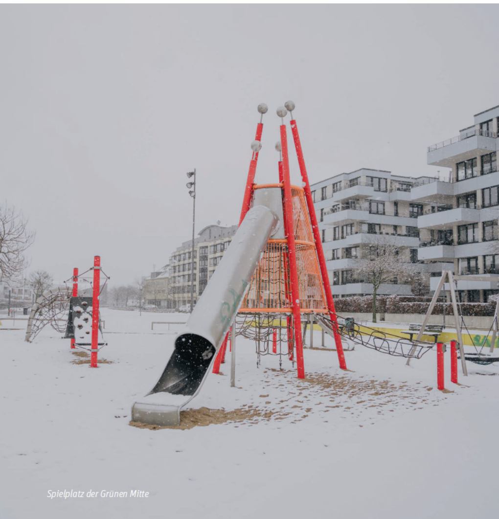
Spielplatz der Grünen Mitte

DER PARK DER GRÜNEN MITTE WIRD GEMEINSAM GENUTZT. GESTALTET UND GEBAUT WURDE DAS AREAL ALLERDINGS VON PRIVATWIRTSCHAFTLICHEN AKTEUREN.