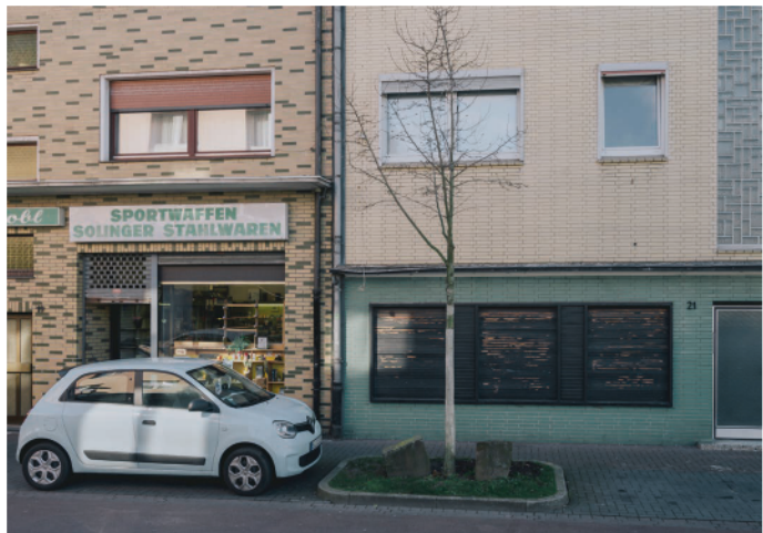
Häuserzeile an der Grünen Mitte