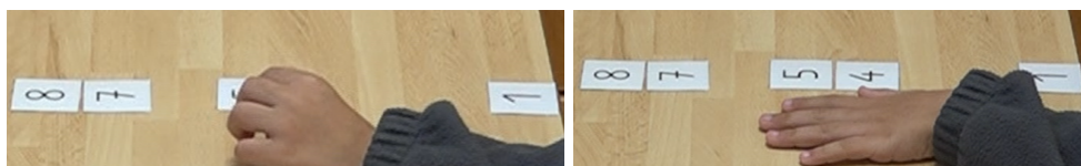
Abb. 2: Einordnung der Zahlen auf einem vertikalen Zahlenstrahl

Der Lernende legt den Zahlenstrahl unerwartet von unten nach oben und schätzt dabei die Größe der Zahlen im Vergleich zur Bezugszahl korrekt ein.