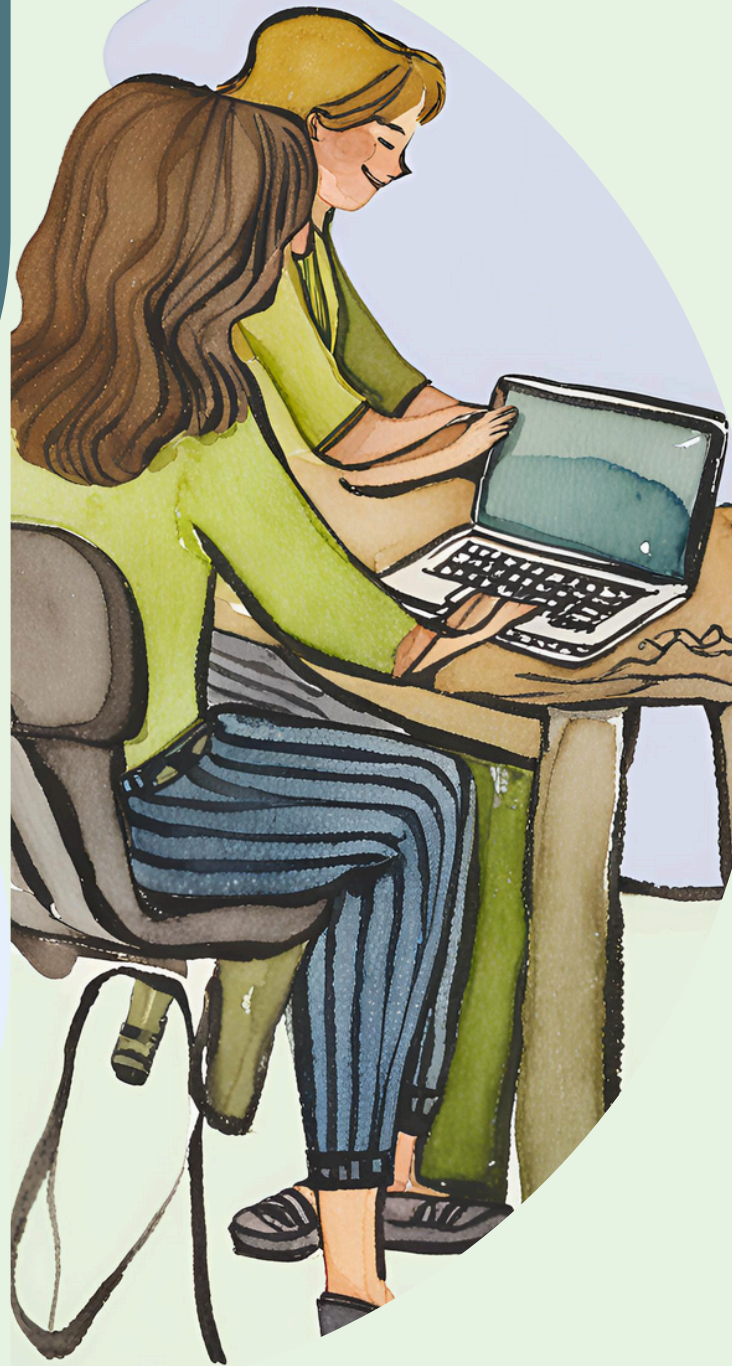
Zeichnerische Abbildungen generiert durch KI-Bildgenerator (Canva)