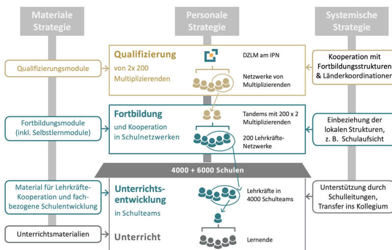
Abb. 1: Struktur von QuaMath mit drei Implementationsstrategien auf drei Ebenen

Ziel des QuaMath-Programms (Unterrichts- und Fortbildungs-Qualität in Mathematik entwickeln) ist die Stärkung der mathematischen Bildung von der KiTa bis zum Abitur (Prediger et al., 2024). In dem auf 10 Jahre angelegten, von KMK und DZLM gemeinsam initiierten Programm werden Entwicklungsprozesse von der Unterrichtsebene über die Fortbildungsebene bis hin zur Qualifizierungsebene (Drei-Tetraeder-Modell, Prediger et al., 2017) angestoßen. Dabei werden drei Strategien verfolgt: die materiale Strategie, die durch Bereitstellung geeigneter Fortbildungs- und Unterrichtsmaterialien unterstützt, die personale Strategie, die die beteiligten Personen zur Qualitätsentwicklung professionalisiert, und die systemische Strategie, die darauf abzielt, geeignete Rahmenbedingungen herzustellen, damit die intendierten Entwicklungsprozesse auch gelingen können (siehe Abb. 1).