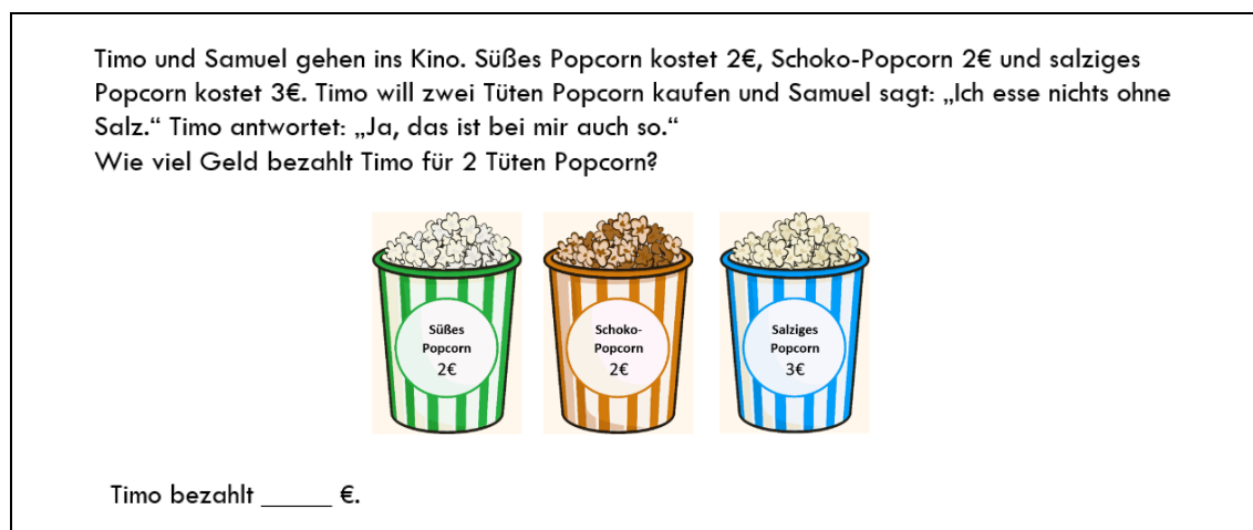
Abb. 2: Doppelte Verneinung bei außermathematischen Interpretationskontext

Nach der Bearbeitung der Aufgaben erfolgte ein Interview, in dem die Teilnehmenden ihre Antworten zunächst begründeten und danach die von der Testleiterin präsentierte Interpretationsalternative beurteilten. Die