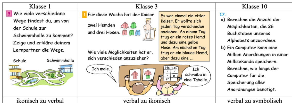
Abb. 1: Beispiel-Kombinatorikaufgaben zu den häufigsten Darstellungswechseltypen (eigene Darstellung in Anlehnung an bestehende Aufgaben)

Betrachtet man die Darstellungswechsel genauer, zeigen sich im Anfangsunterricht eher Wechsel von der ikonischen zur verbalen Ebene (siehe Abbildung 1). In Klasse 3 und 4 erfolgen die Wechsel tendenziell eher andersherum. In den höheren Schulstufen regen die meisten Kombinatorikaufgaben als Textaufgaben eine Transformation von verbal zu symbolisch an.