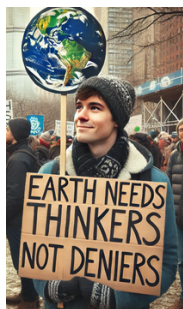
Abb. 1. Motto des Protests in New York, 2020.

Unter den Forschungsaktivitäten des Ludwigsburger Teilprojekts wurden 3 zweistündige Interventionen zu folgenden Themen geplant: