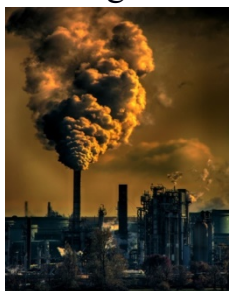
Abb. 2: CO 2

Als Beispiel einer Aktivität der ersten Intervention beschreiben wir kurz die Lernumgebung zu CO 2 Emissionen in den letzten 400.000 Jahren. Als Einführung in das Thema sehen die Schüler/Innen zunächst eine typische Aufnahme, wie in Abbildung 2. Die Schüler/Innen lesen auch, dass auf Klimakonferenzen die Reduktion dieser Emissionen wichtiger Verhandlungsgegenstand bei den Treffen der Staatsvertretungen ist. Immer wieder wird die menschliche Rolle bei der Erhöhung der atmosphärischen CO 2 -Konzentration allerdings angezweifelt und auf regelmäßige Schwankungen im Verlauf der Erdgeschichte verwiesen.