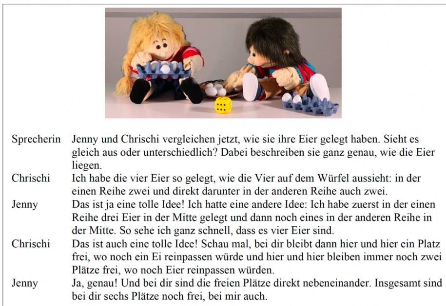
Abb. 2: Auszug aus dem Eltern-Kind-Video zur Aktivität "Eier legen"

Im Kindergartenteil wird durch die Klärung der Handhabung des Materials und Sprachvorbilder der Familienteil vorbereitet. Hier wird die Unterrichtssprache Hochdeutsch verwendet. Im Familienteil werden die Eltern durch ein Elternvideo in die Thematik und die Spielbegleitung eingeführt. Durch Eltern-Kind-Videos werden die Aktivitäten vorgestellt, die in der Familie umgesetzt werden können.