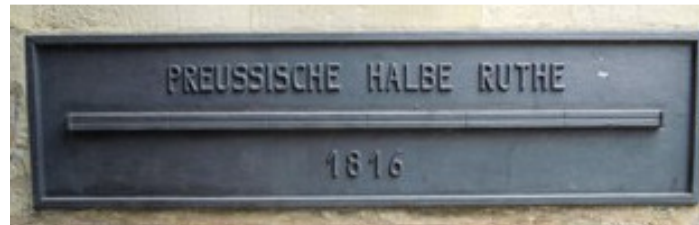
Abb. 2: „halbe Ruthe“ am historischen Rathaus

An einer Seite des historischen Rathauses am Prinzipalmarkt ist das Abbild einer „preussischen halben Ruthe“ angebracht (Abb. 2). Neben der Thematisierung alter Längenmaße und der Berechnung von Entfernungen geht es hier um arithmetische Aspekte, denn ursprünglich fanden Umrechnungen zwischen diesen alten Maßen im duodekadischen System statt: Eine „Ruthe“ entspricht zwölf „Fuß“ bzw. zwei „Klaftern“.