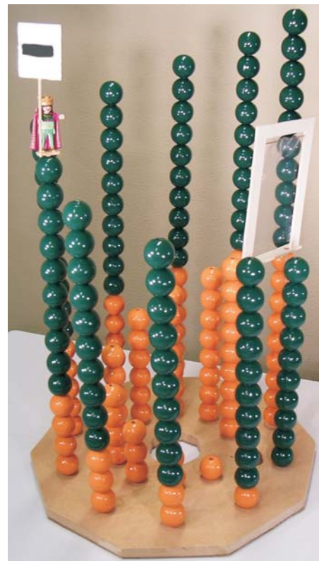
Abb. 2: Die "große" Rechenwendeltreppe.

Anders als bei herkömmlichen Zugängen in Schulbüchern werden beim Einsatz der RWT Ergebnisse zu Additionsaufgaben nicht „rückwärts“ über eine vorherige Zerlegung von Anzahlen in zwei Anteile erschlossen. Der Gefahr des Verweilens beim sogenannten zählenden Rechnen begegnen wir nicht dadurch, dass wir das den Zahlen zu Grunde liegende Bauprinzip der Nachfolgebildung ausklammern oder dieses gar als schlecht ansehen sondern dass wir anregen, auf dem Fundament dieses Bauprinzips elegantere, weiterreichende Bewegungen im Zahlraum auszuüben. Der Zahlraum soll dabei funktional erschlossen und strategisch geschicktes Rechnen ins Visier genommen werden. Ausgehend vom Arbeitsauftrag an die Kinder von verschiedenen Positionen aus den Nachfolger bzw. Vorgänger um eins zu bilden, stellt sich die Frage, was passiert, wenn die Figur um zwei, drei oder