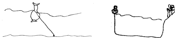
Abb. 2: Schülerskizzen zu „Boje“

Skizzen: Der Anteil der Schülerlösungen, die eine Skizze enthalten, stieg von 60% im Vortest auf 87% im Nachtest. Eine genauere Betrachtung der Skizzen zeigt jedoch, dass sie von sehr unterschiedlicher Qualität sind: Während die Lernenden im Vortest ausschließlich Skizzen mit lösungsrelevanten Angaben erstellten, entstanden im Nachtest auch solche, die lediglich als externalisierte Vorstellung des Aufgabenkontextes verstanden werden können (siehe etwa die Skizzen aus Abb. 2). Die Auswertung mithilfe eines Ratingschemas zeigte schließlich, dass bei steigender Anzahl der Skizzen im Nachtest deren mittlere Qualität nahezu konstant geblieben ist.