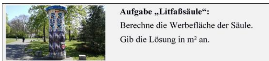
Abb. 1: Aufgabe „Litfaßsäule“ aus dem Treatment