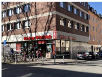
Anhang 4: Vorgabe ausgewählter Einkaufsorte im Online-Fragebogen (Beispiel)

Rewe Friedrich/Freidank, Landgrafenstraße