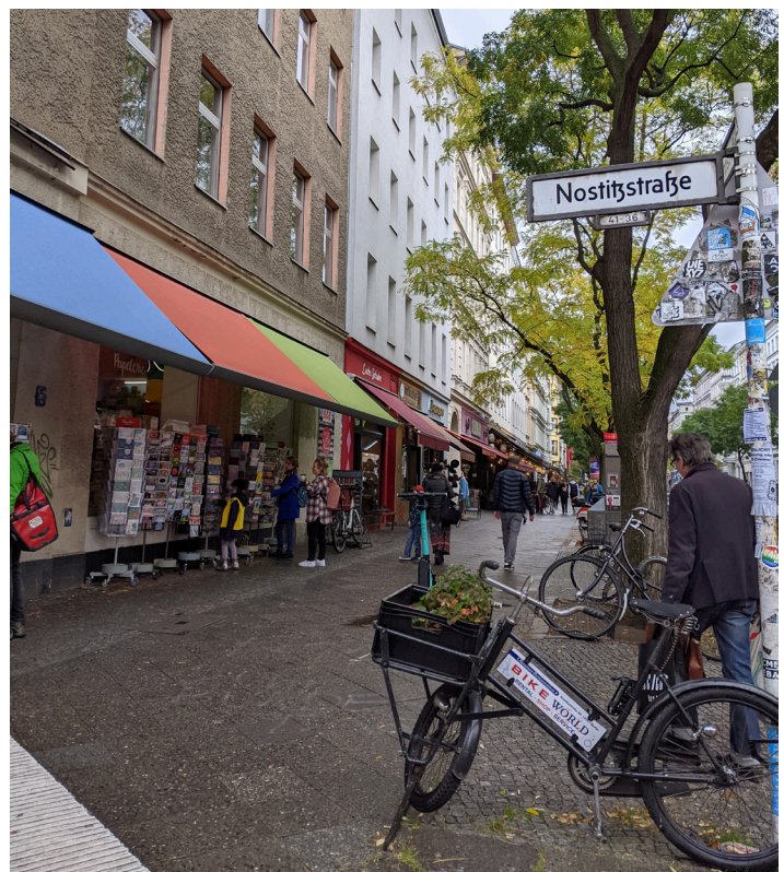
Abbildung 2: Der urbane Raum - dicht und mit Fokus auf den Umweltverbund. Eigene Aufnahme, 2022.

Es lässt sich also zum jetzigen Zeitpunkt festhalten, dass die Wanderungsbewegungen der erwerbstätigen Bevölkerung in den suburbanen und ländlichen Raum durch die vermehrte Arbeit im Homeoffice in (Post-)Pandemiezeiten verstärkt werden. Insbesondere Großstadtbewohner*innen legen eine besonders hohe Umzugsbereitschaft in suburbane und kleinstädtische Räume an den Tag. Welchen Stellenwert die Möglichkeit zur Arbeit im Homeoffice aber bei der tatsächlichen Standort-