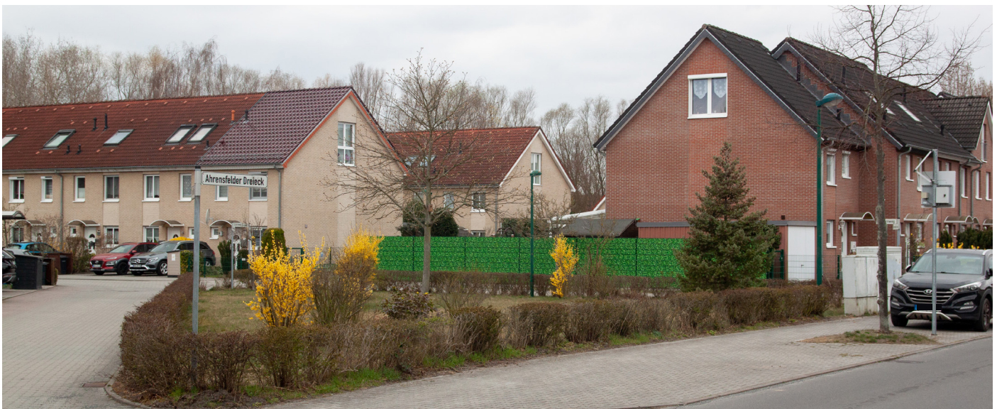
Abbildung 1: Der suburbane Raum - mehr Platz und Konzentration auf den MIV.

Es lässt sich noch nicht eindeutig sagen, wie nachhaltig die Corona-Pandemie die Wohnstandortentscheidungen von Haushalten beeinflusst. Umzugsentscheidungen lassen sich in die grundsätzliche Entscheidung für einen Wohnstandortwechsel und die anschließende Auswahl des Zielorts entsprechend der Wohnwünsche und der (finanziellen) Möglichkeiten bzw. Restriktionen eines Haushalts unterteilen (Kalter 1997: 66f.) Bisher lässt sich feststellen, dass sich durch die Pandemie die Kriterien von urban lebenden Haushalten an ihren Wohnraum dahingehend verändert haben, dass sie angesichts des angespannten Wohnungsmarktes eher in ländlichen Standorten realisiert werden können. So wünschen sich Haushalte mehr Platz, um diesen u.a. fürs Arbeiten nutzen zu können (Münter et al. 2022: 2). Die Möglichkeit des ortsunabhängigen Arbeitens wird als ein möglicher Pull-Faktor diskutiert, der zukünftig insbesondere Haushalte, deren Wohnbiographie in einem ländlichen Raum angefangen hat, aus den Städten nicht mehr nur in den suburbanen Raum,